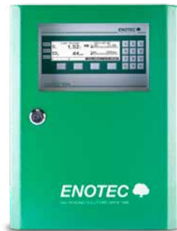
Fig. SILOTEC 8000 analyzer system