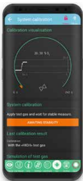
ENOTEC REMOTE APP Simple control of ENOTEC analyzers