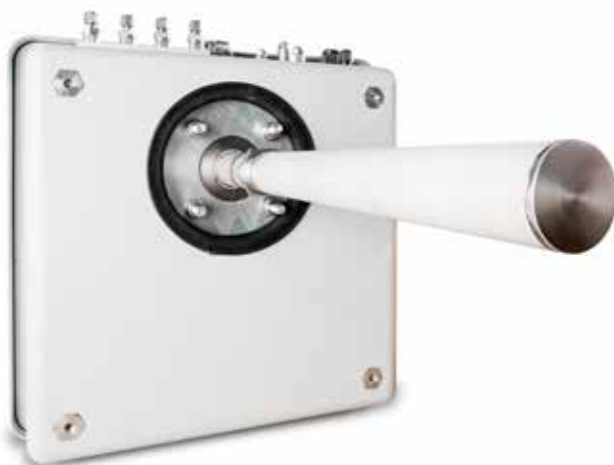
Fig. SILOTEC probe